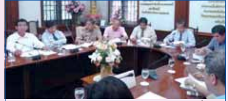
27 พฤศจิกายน 2551 คณะกรรมการเดิน-วิ่ง การกุศล 72 ปี ต.อ. ประชุมเพื่อเตรียมงาน