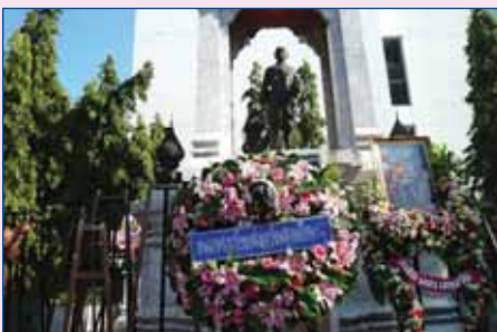
23 ต.ค.2551 ถวายบังคม พระบรมรูป ร.5