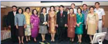
24 กันยายน 2551 งานเลี้ยงส่งเพื่อเป็นเกียรติแก่ ท่านผู้อำนวยการฯ และอาจารย์ทุกท่าน ที่เกษียณอายุราชการ