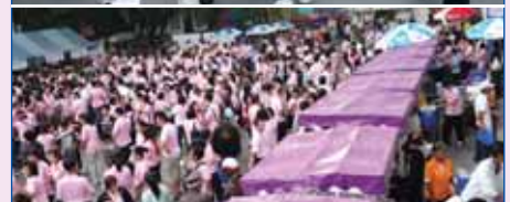
29 พ.ย. 2551 งานเดิน-วิ่งการกุศล 72 ปี ต.อ.