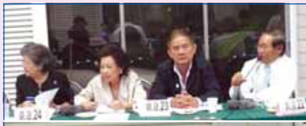
4 พฤศจิกายน 2551 งานเลี้ยงสังสรรค์ตัวแทนรุ่น ครั้งที่ 1 วันอังคารที่ ดำเนินการโดย ฝ่ายสมาชิกสัมพันธ์และประสานงานรุ่น