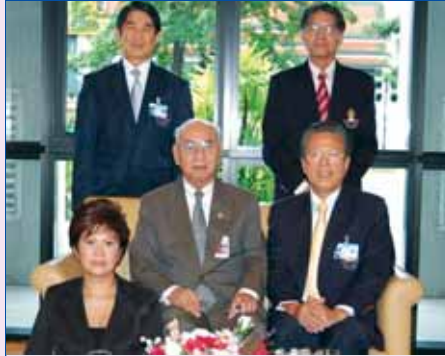
28 ตุลาคม 2551 คณะกรรมการ สนตอ. เข้าเรียนพทานองคมนตรี พล.อ.อ.กำธน สินธวานนท์ เพื่อแนะนำคณะกรรมการ สนตอ. และเรียนเชิญ ท่านเป็นประธานงานเดิน-วิ่งการกุศล ตอ. ครั้งที่ 8