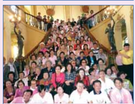
21 ธันวาคม 2551 กิจกรรมพวาอาจารย์เที่ยวเรือ Grand Pearl