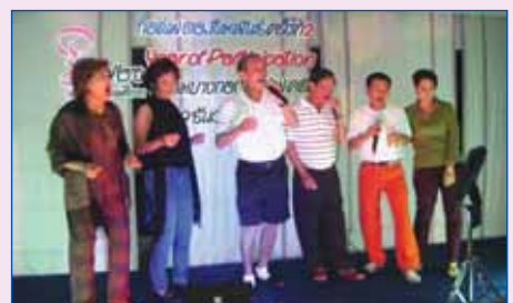
9 ธันวาคม 2551 กอล์ฟ ตอ.สัมพันธ์ครั้งที่ 2 ณ สนามบางกอกกอล์ฟคลับ